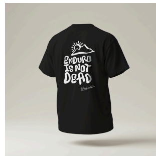
T-Shirt Enduro is not Dead