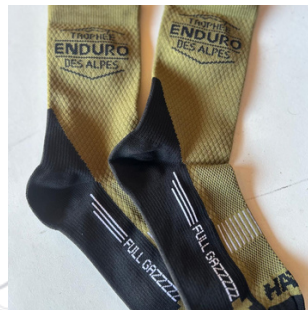
Chaussettes TEA 2026

Les maillots du TEA 2026 pré commandés sont à récupérer toute l'année à la boutique sur le village départ/arrivée !