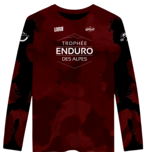
Maillot Noir TEA 2026