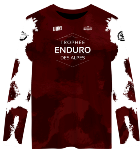
Maillot Blanc TEA 2026