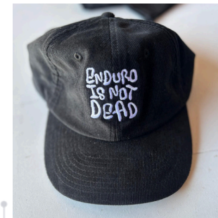
Casquette Enduro is not Dead