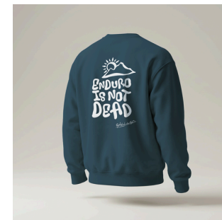
Sweat Enduro is not Dead